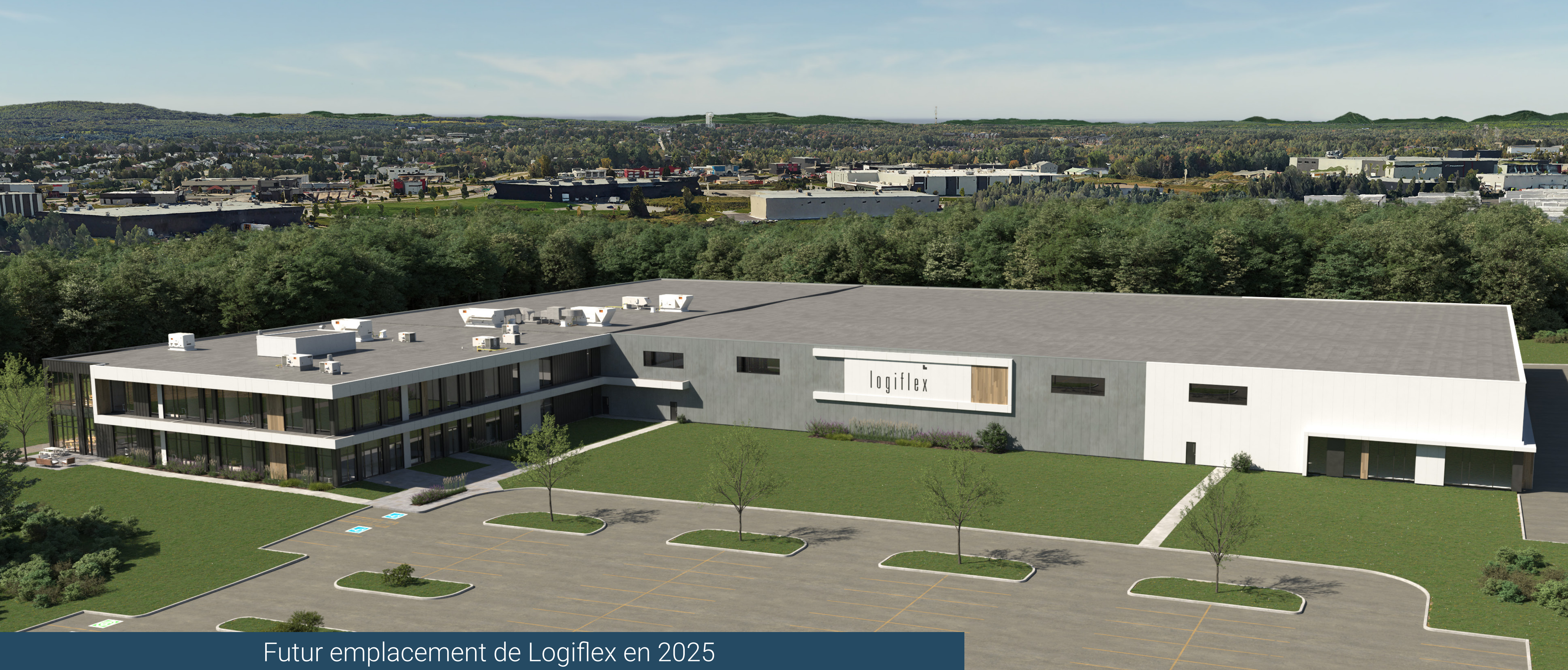
Futur emplacement de Logiflex en 2025