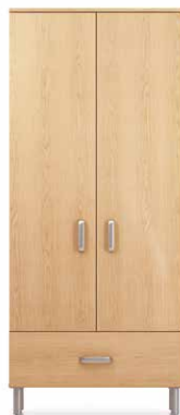
PEN5 - PEN6