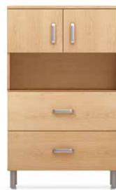
COM2 - HL28