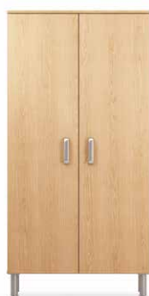
PEN3 - PEN4