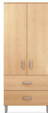
PEN7 - PEN8