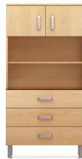
COM3 - HLA40