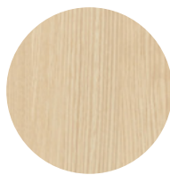
Mélamine Frêne naturel*