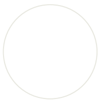
Mélamine Blanc polaire