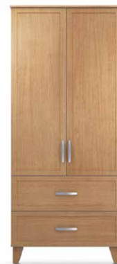
PEN7 - PEN8