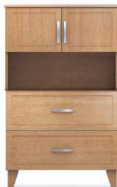
COM2 - HL28