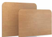
TLRT - PLRT