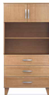
COM3 - HLA40