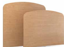
TLCX - PLCX