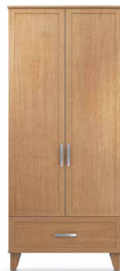
PEN5 - PEN6