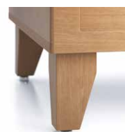
Pattes de bois