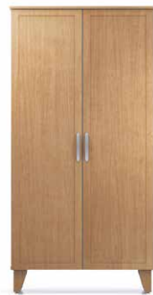
PEN3 - PEN4