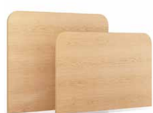
TLRT - PLRT