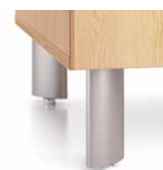
Pattes ovales en métal