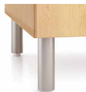
Pattes tubulaires en métal