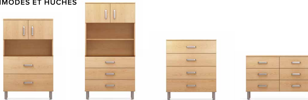
COM2 - HL28