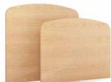
TLCX - PLCX