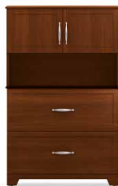
COM2 - HL28