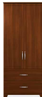
PEN7 - PEN8