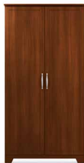
PEN3 - PEN4