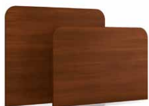
TLRT - PLRT