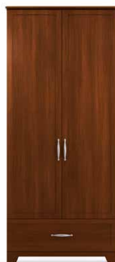
PEN5 - PEN6