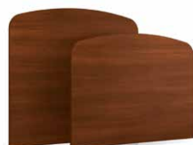
TLCX - PLCX