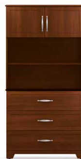
COM3 - HLA40