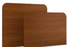
TLRT - PLRT