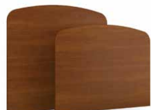
TLCX - PLCX