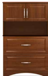
COM2 - HL28