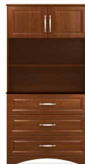
COM3 - HLA40