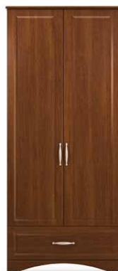
PEN5 - PEN6