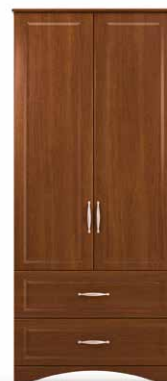
PEN7 - PEN8